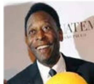
PELE (Edson Arantis du Nasimentu)

Messi öz döwrüniň iň güýçli futbolçylary tarapyndan dürlüçe atlandyrylypdy. Arsen Wenger ony «Plastilin